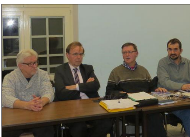
■ Les membres du bureau ont été reconduits.