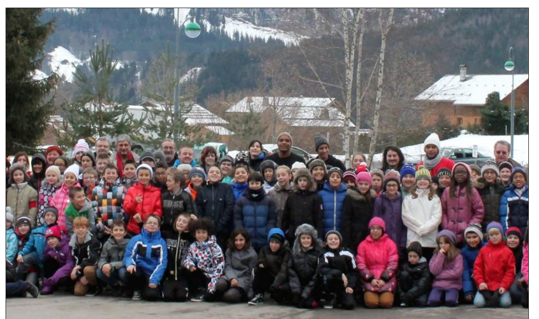
■ Les 110 élèves ont multiplié les activités durant leur séjour.

Les jours précédents, le programme établi avait été suivi à la lettre, entre pratique du ski de fond, luge, et ski de descente sur le domaine de La Clusaz. Les activités pédagogiques ont été construites en lien avec l'environnement. Le tout complété par des visites à la maison du patrimoine du Grand-Bornand, à l'écomusée du bois et de la forêt de Thônes, sans oublier une balade en calèche, la rencontre avec un météorologue et les veillées avec conteur.