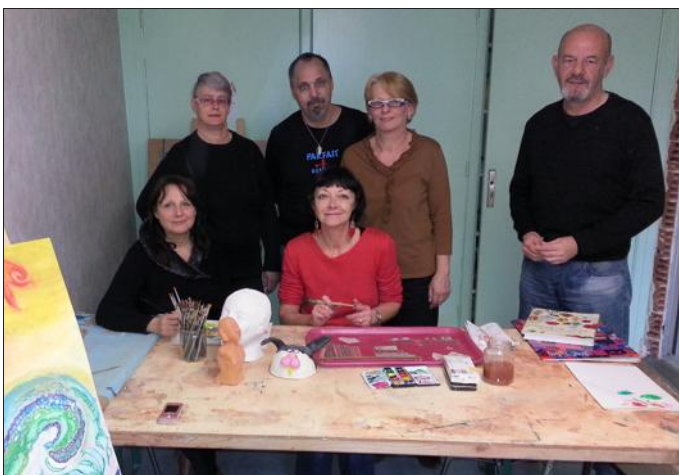
■ Tous ensemble au foyer Foch.

Incontestablement, en fréquentant cet atelier d'art-thérapie, les artistes trouvent là une manière de guérir les maux du quotidien.