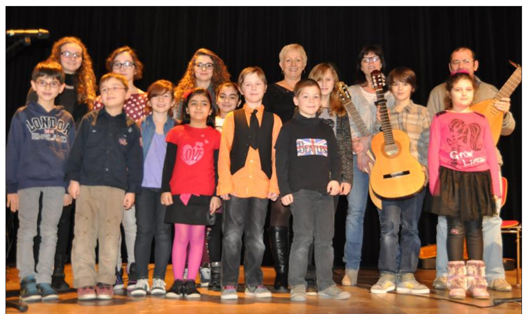
■ Les jeunes musiciens ont présenté des genres très différents lors de leur audition sur la scène du CILM.

Il a accompagné quelques élèves avec son luth renaissance. Fort de leur succès, les cours individuels affichaient complet.