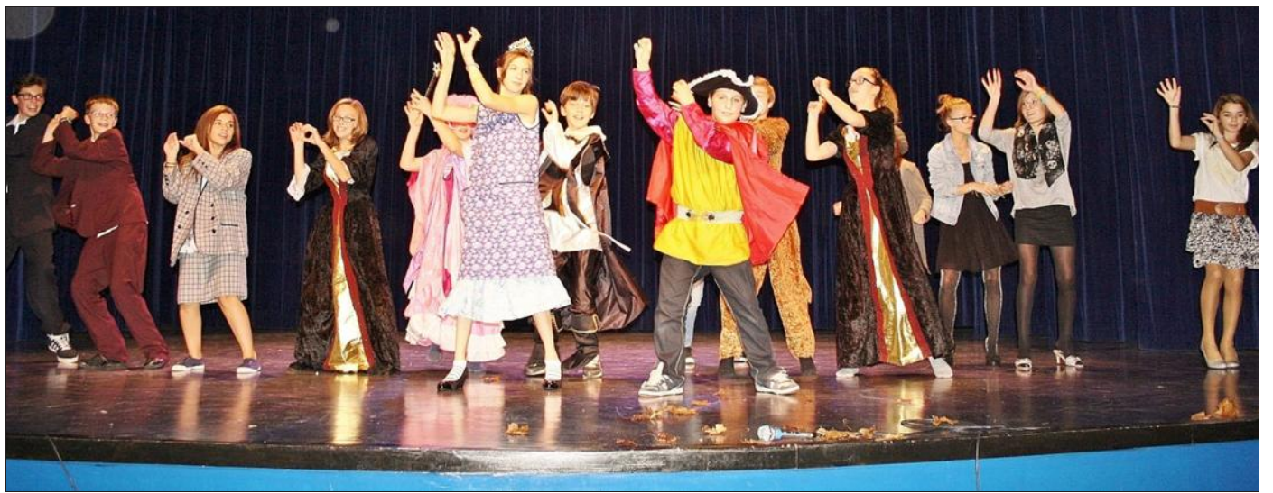
■ « Ma télé décalée », un spectacle entièrement créé par les ados.

L'été dernier, les ados de l'accueil jeunes avaient pu profiter d'une semaine au centre socioculturel de Seichamps pour monter une veillée spectacle sur le thème des « Invraisemblables talents ». Après cette expérience, tous avaient envie de revivre l'aventure, avec cette fois un vrai public. Unaniment, ils ont proposé de réaliser un spectacle pour les enfants plus jeunes qui fréquentent le centre de loisirs de l'AFRS à l'espace des Parapluies. L'équipe d'animation de l'accueil jeunes a donc fait en leur nom la proposition à l'équipe de l'AFRS qui a tout de suite accepté avec enthousiasme cette initiative. Pendant les vacances de la Toussaint, les jeunes ont retrouvé la scène du centre socioculturel avec ce défi de monter un spectacle en une semaine. Le projet a été intitulé « Ma télé décalée » et réalisé de manière exemplaire car les ados ont su s'entendre, s'en-