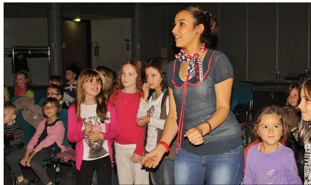
■ Les 2 à 11 ans ont participé à des sorties et des ateliers créatifs.