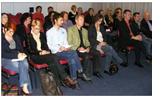
■ Une conférence afin de préparer la loi qui sera appliquée au 1 er janvier 2015.