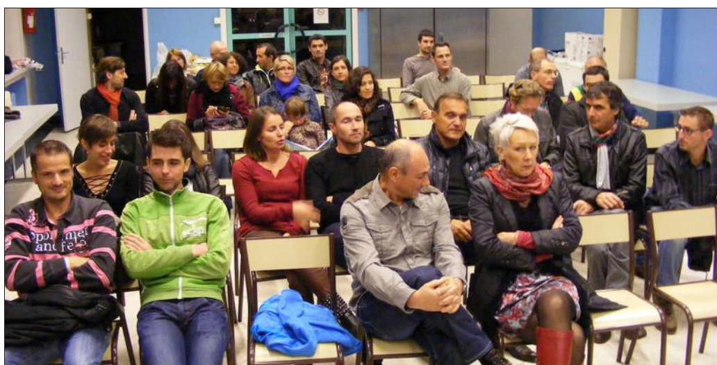
■ L'association affiche de beaux podiums.